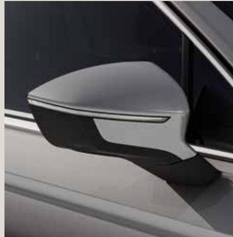
Reflex Silver** St XE