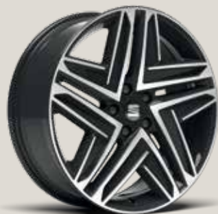
Exclusive 19" 37/1 Machined