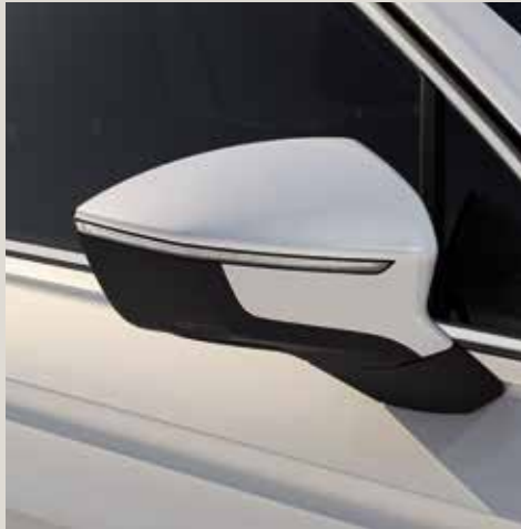
Oryx White*** St XE