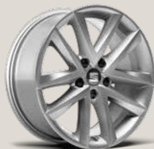
Dynamic 17" 37/1