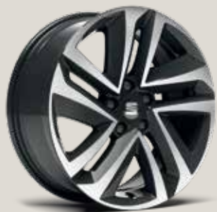
Performance 18" 37/1 Machined