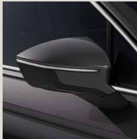
Indium Grey** St XE