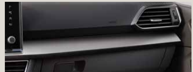
Olot-kangasverhoilu mustilla Alcantara® -yksityiskohdilla – FG