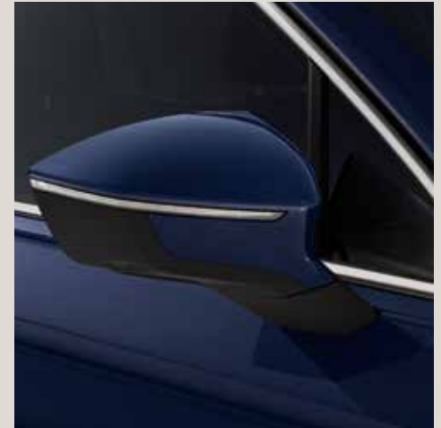
Atlantic Blue** St XE