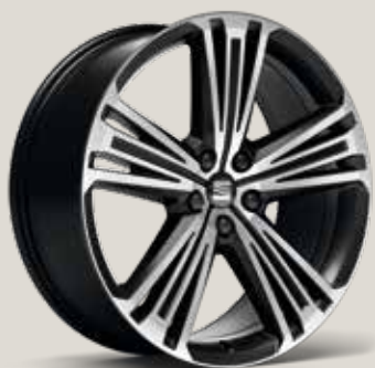
Supreme 20" 37/1 Machined