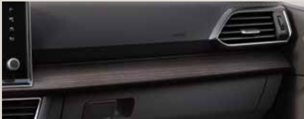
Baza-kangasverhoilu / Alcantara® / PVC Bison – LM