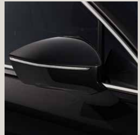
Deep Black** St XE