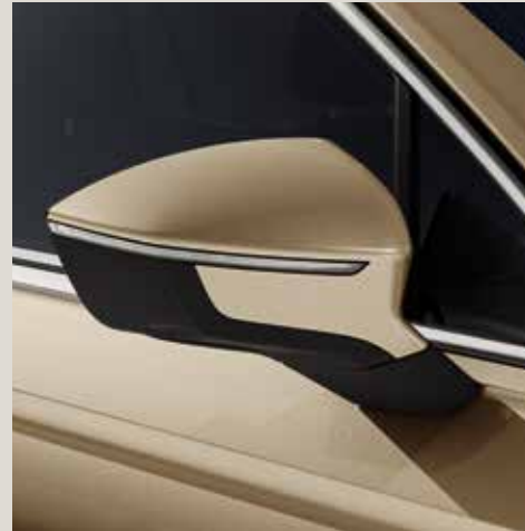
Titanium Beige** St XE