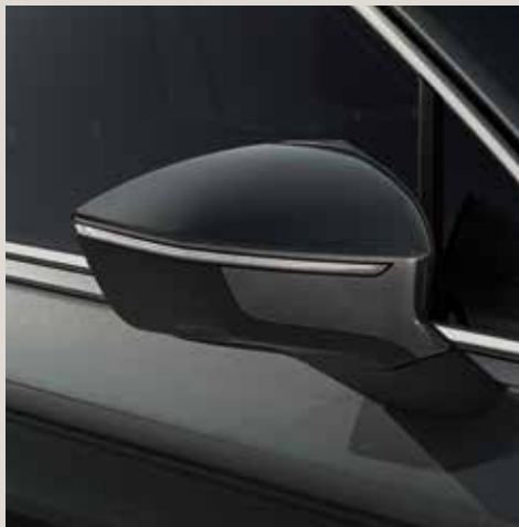
Dark Camouflage*** St XE