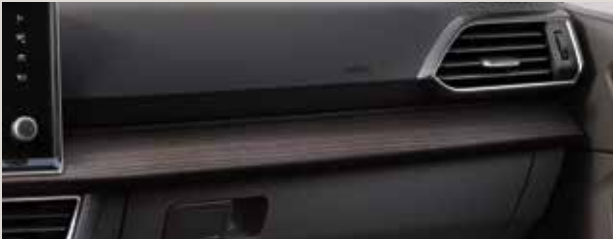
Vienna Black -nahkaverhoilu - LM + PL1