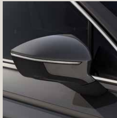
Urano Grey* St XE